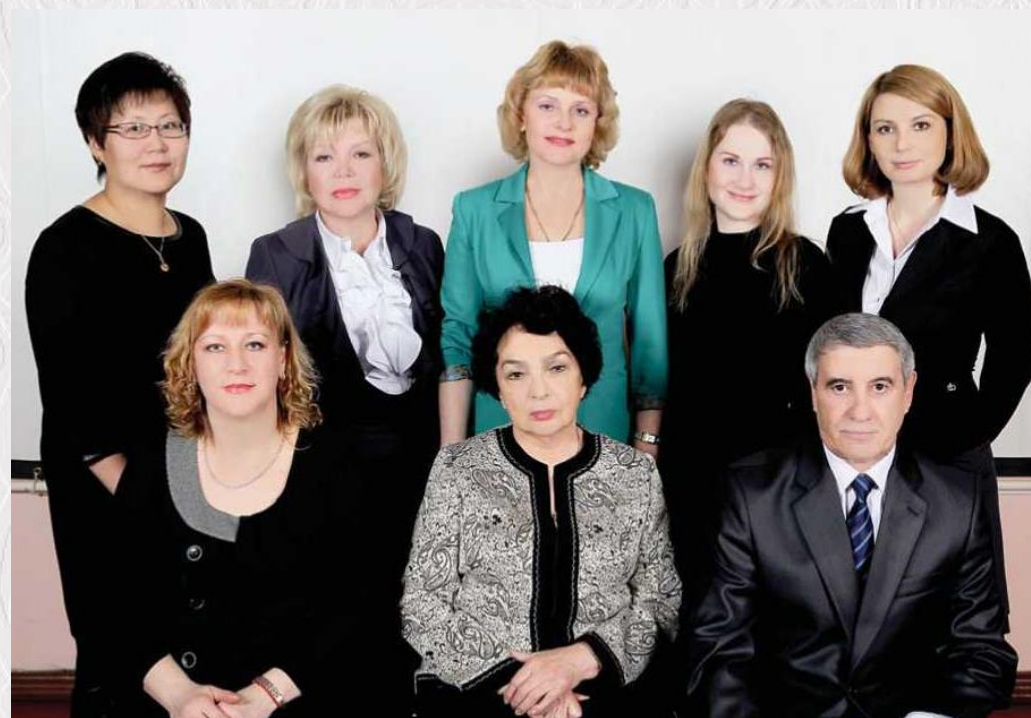
Кафедра акушерства и гинекологии педиатрического факультета и факультета дополнительного профессионального образования 2013 г.